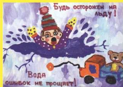
Рисунок Зенищевой Ксении