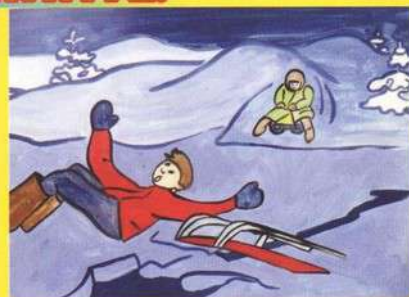
Рисунок Тарновской Юлии