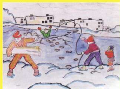
Рисунок Игнатова Андрея