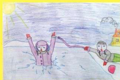
Рисунок Алексеевой Софьи